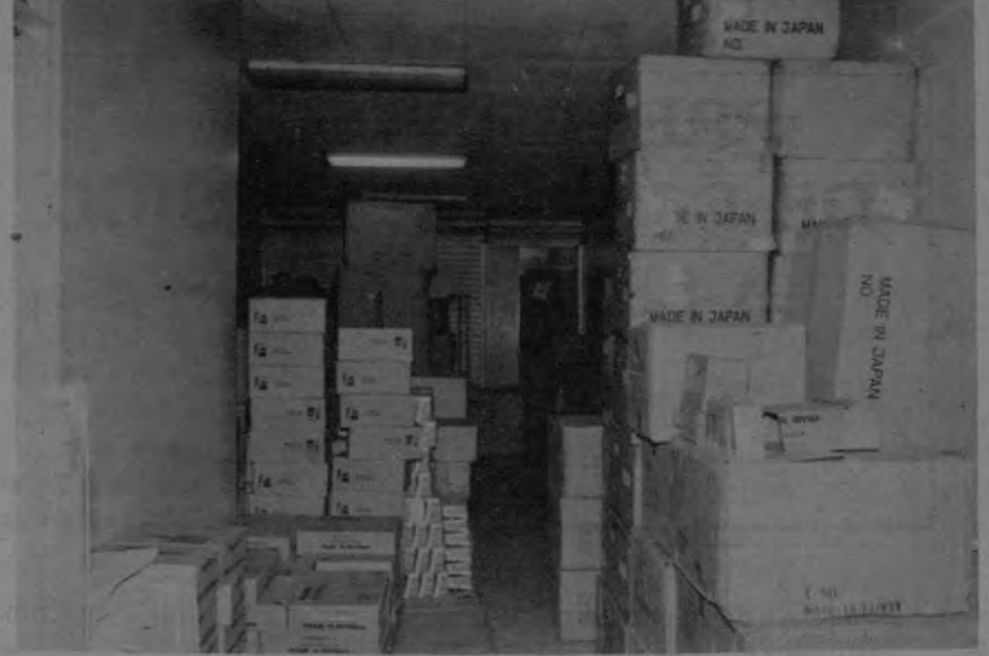
Se puede apreciar una de las bodegas de Filtro Motor en donde existen cantidad considerable de filtros que son una garantía para el usuario.

Las fábricas nacionales no tienen la capacidad de producción de volumen de filtros que ocupa el país y de la variedad de filtros para surtir el mercado ya que se satisface únicamente aproximadamente un 5% de la demanda.